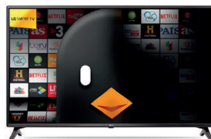
LG 43" 43LJ614V 336,75 €

Pantalla 43", Full HD, sonido 2.0, sintonizador DVB T2/C/S2, 2 x HDMI, 1 x USB, VESA 200 x 200