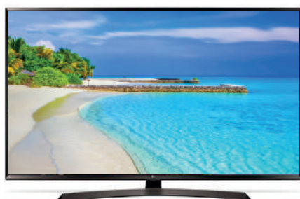
LG 43" 43UJ634V 405,83 €

Pantalla 43", Full HD, sonido virtual surround 2.0 ch 10 W, sintonizador TDT2, Smart TV, procesador Dual Core, WiFi 802.11ac, eficiencia A+, VESA 200x200