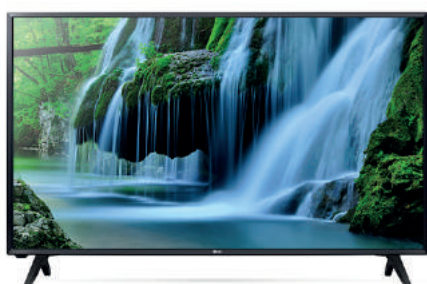
LG 32" 32LJ500U 177,83 €

Sólo por ser miembros de Feprohós, los asociados podrán acceder a un catálogo completo de productos en condiciones ventajosas. El único requerimiento será el solicitar cuenta de alta en Telenets señalando su pertenencia a Feprohós.