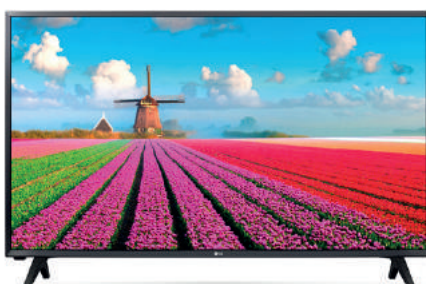
LG 43" 43LJ500V 267,70 €

Pantalla LED 32", res HD, sonido 2.0, sintonizador DVB-T2/C/S2, 2 x HDMI, 1 x USB, VESA 100 x 100