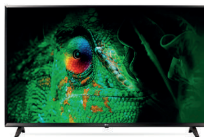
LG 55" 55UJ630V 596,11 €

Pantalla 43" IPS, 4K UHD, Active HDR, Ultra Surround, Smart TV webOS 3.5, Sonido ultra surround 2.0ch 20 W, 2 x USB (1 grabador), 3 x HDMI