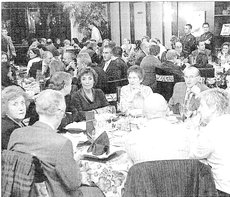
Asistentes al evento organizado anoche por la federación de hostelería en un restaurante vigués.